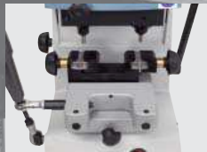
4. Feste, einfache Spannbacken