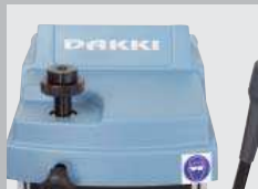
1. Halbautomatische Tastjustierung