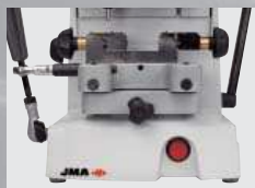
3. Achsblockierung Senkrechtverschiebung